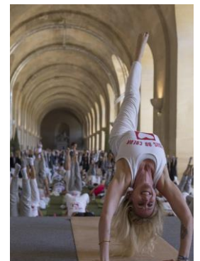
Des professeurs de yoga inspirants